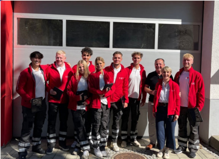
Saale-Holzland-Kreis, den 27.10.2025