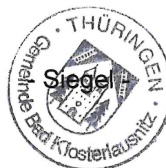
Kevin Steinbrücker Bürgermeister